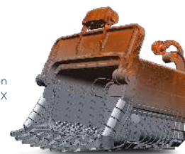
Un modelo sólido paramétrico creado en Geomagic Design X

Si puede diseñar en CAD, ya puede empezar a utilizar Geomagic Design X. Su nueva interfaz de usuario y sus herramientas de trabajo, totalmente renovadas, facilitan más que nunca la creación rápida y precisa de datos de modelo y CAD 3D según diseño y según construcción.